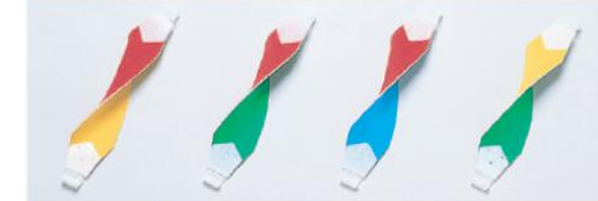
3150-A 3150-B 3150-C 3150-D ●赤/黄 ●赤/緑 ●赤/青 ●黄/緑