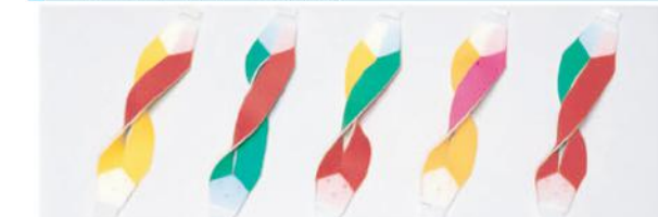
3152-A 3152-B 3152-C 3152-D 3152-E ●黄・赤/黄 ●緑・赤/緑 ●黄・緑/赤 ●黄・ピンク/黄 ●緑・赤/赤