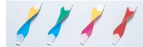
3150-E 3150-F 3150-G 3151-A ●黄/青 ●緑/青 ●黄/ピンク ●赤/赤