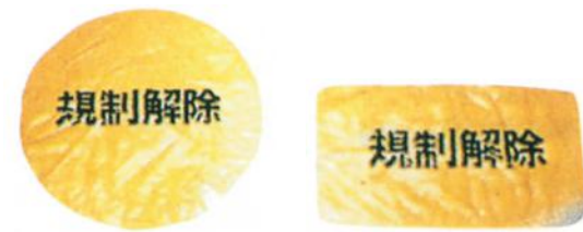
標識カバー丸 標識カバー角