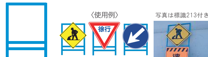
W550の看板枠に標識を取付けできます。