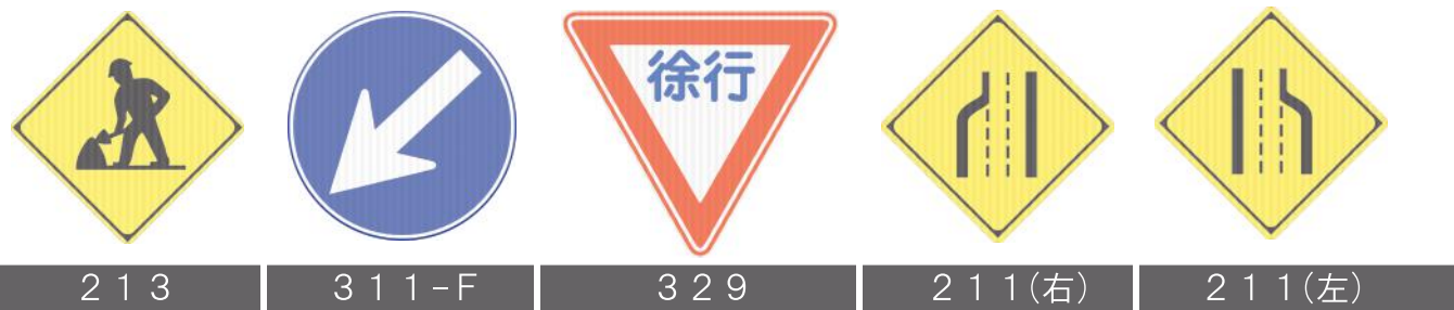
213 311-F 329 211(右) 211(左)