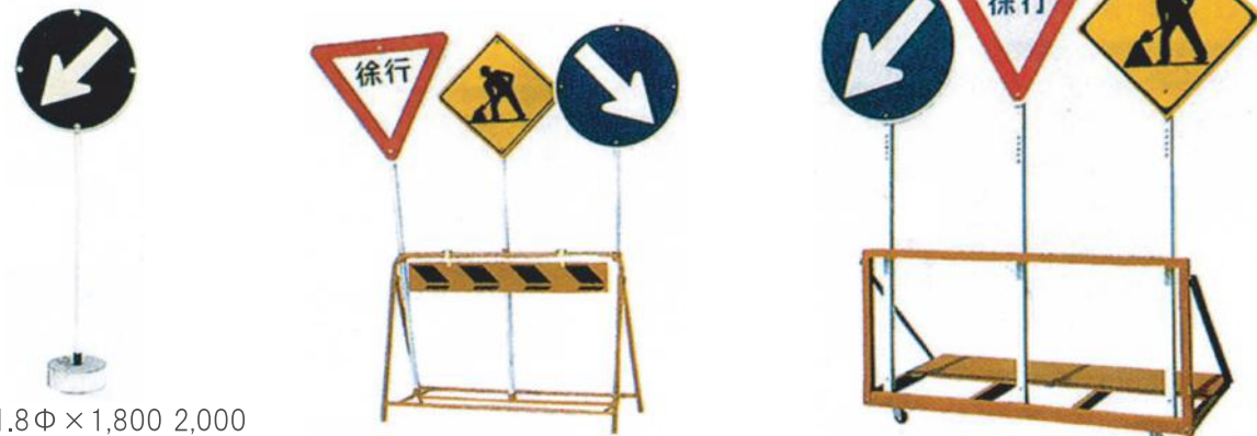
ポール 31.8φ×1,800 2,000 ブロック 280φ×100