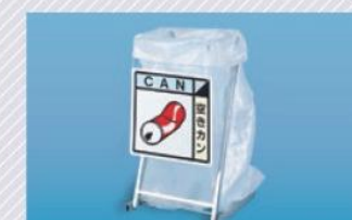
■使用例 分別標識を組み合わせると一層効果的です。 (標識は別売です。)