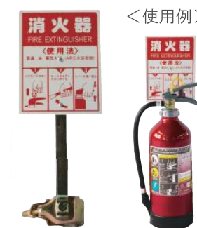
消火器 キャッチャー