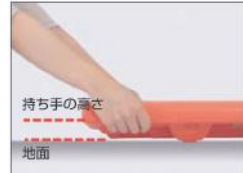
レスキューボードベンチ L=1800