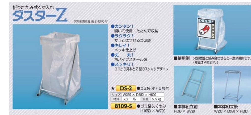
折りたたみ式くず入れ ダスター-Z