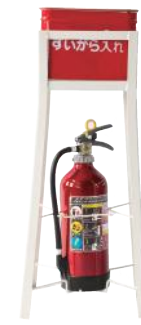
消火器10型設置式吸殻入れ