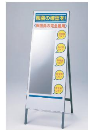
308-131 (枠付) サイズ：(枠)1600×555mm (板)1400×555mm 材質：鉄(ミラー/ステンレス) 重量：約9kg ミラーサイズ：900×330×1mm厚