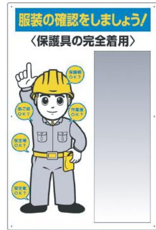
308-07B サイズ：(本体)1210×800×3mm厚 (ミラー)914×300×2mm厚 材質：(本体)アルミ複合板(穴6) (ミラー)ステンレス複合板