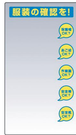
308-14 サイズ：900×500mm 材質：ステンレス (4.2mmφ穴6) 重量：約3.4kg