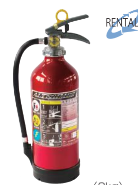
消火器 10型 (3kg)