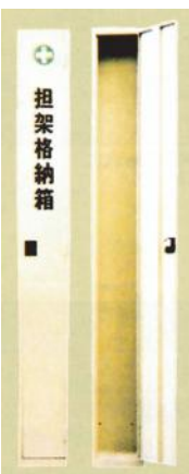
メラミン樹脂塗装 鉄板製

1台にスタンダード型が2台収納 できます。 寸法：開口280×高さ 2300×奥行200mm