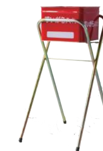
半缶吸殻入れ (単体)